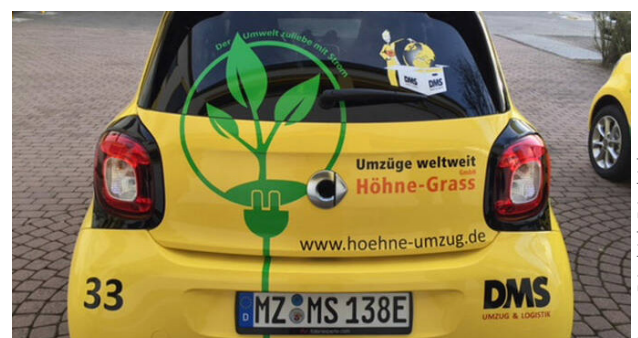
Elektroauto der DMS Friedrich-Gruppe