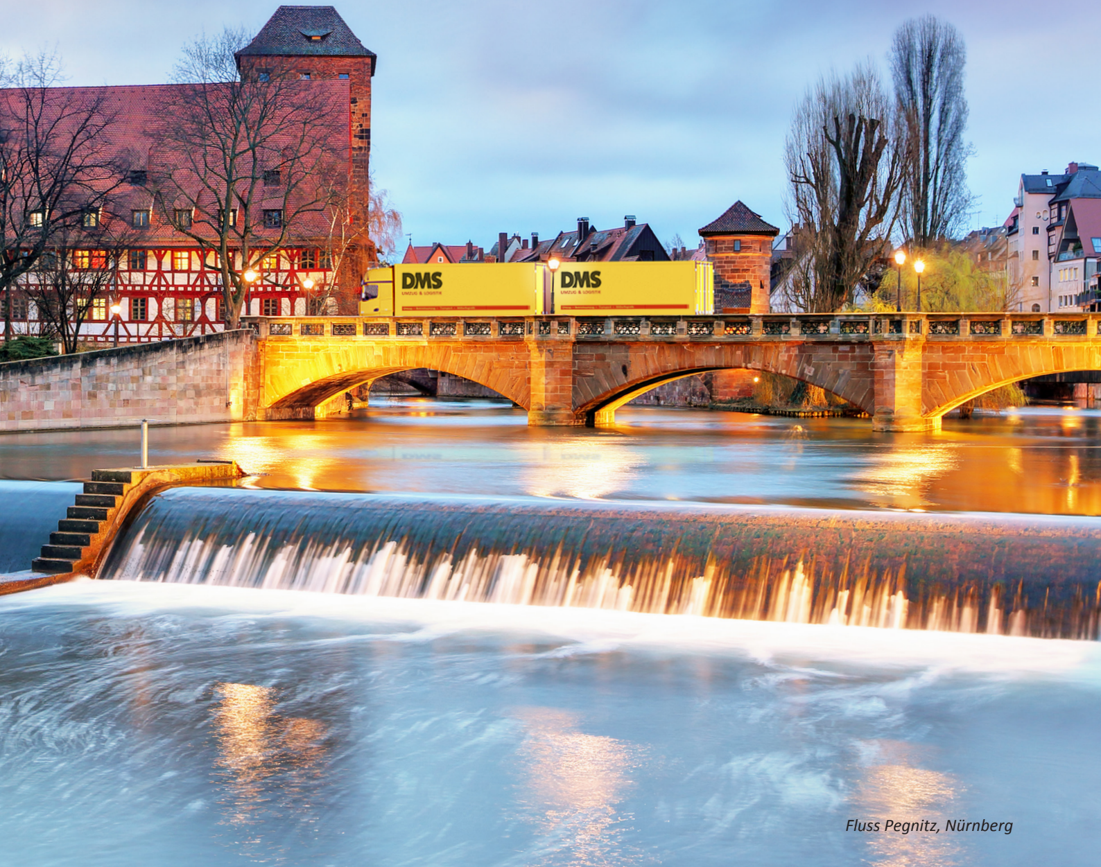
Fluss Pegnitz, Nürnberg