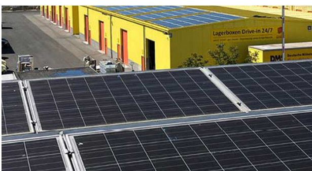
Solardach auf den Hallen von DMS Friedrich Friedrich

Ebenso wie der Griesheimer Logistiker haben die DMS Zentrale und die weiteren DMS-Betriebe das Thema Klimaschutz hoch auf die eigene Agenda gesetzt. Vielfältige Maßnahmen werden in den DMS-Unternehmen ergriffen, um den Umweltschutz zu stärken und den CO 2 -Abdruck zu reduzieren.