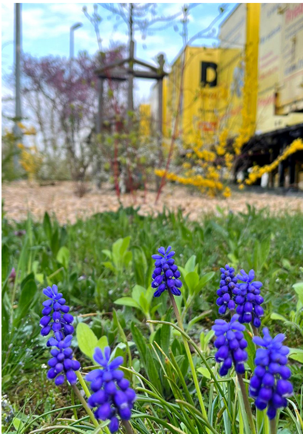
Tiny Forest bei DMS Friedrich Friedrich