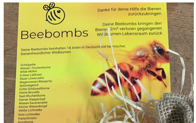
Beebombs bei DMS Schweinsteiger