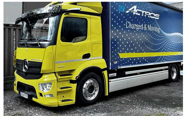
Elektro-LKW von DMS Niesen