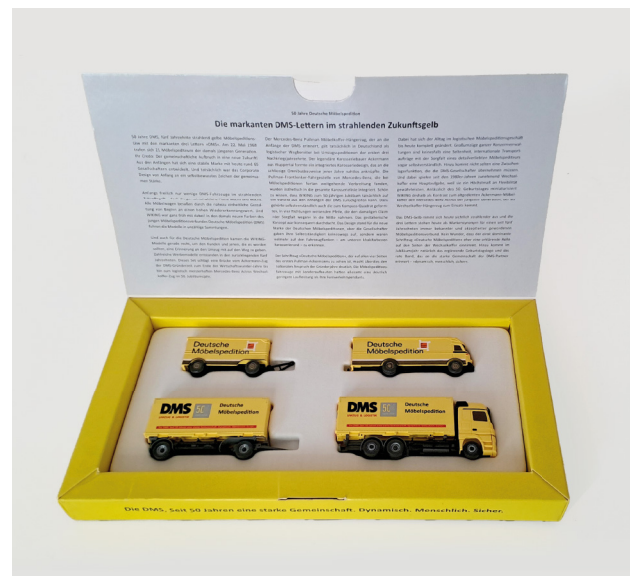
Jubiläumsbox der DMS aus 2018