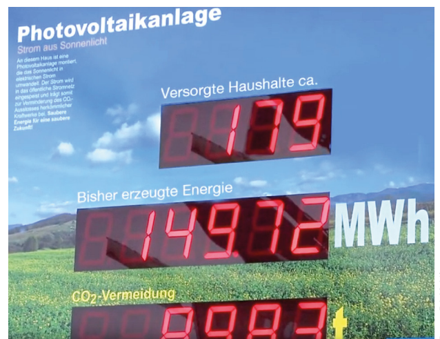
Photovoltaik-Anzeigetafel bei DMS Niesen

Dazu gehören die fortlaufende Modernisierung der Fahrzeugflotte, die Bereitstellung von Möglichkeiten zur CO 2 -Kompensation für Kunden sowie die ISO 14001 Zertifizierung. Regelmäßige Inspektionen zur Gewährleistung der Gerätesicherheit, Schulungen für Mitarbeiter zur Vermeidung →