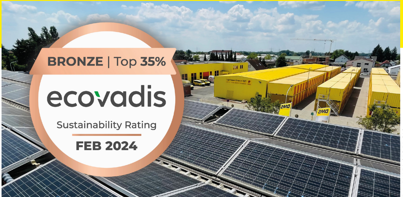
Photovoltaik-Anlage von DMS Friedrich Friedrich | EcoVadis-Auszeichnung

Ein grüner Wandel durchzieht die DMS-Betriebe: Unsere Umzugsunternehmen und Logistiker setzen vermehrt auf ökologische Nachhaltigkeit als zentrales Element ihrer Unternehmensphilosophie. Mit einem Fokus auf CO 2 -Reduktion und Ressourcenschonung revolutionieren sie ihre Betriebsprozesse, vom Fuhrpark bis zu Lagerstätten, um die Umweltauswirkungen zu minimieren. Der Maßnahmenkatalog reicht von der Umstellung auf E-Mobilität über die Nutzung erneuerbarer Energien bis hin zur effizienteren Nutzung von Strom und Wasser.