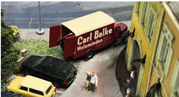
Mini-LKW von DMS Balke im Miniatur-Wunderland

Das Herzstück der Straßenlandschaft ist das »Carsystem«, ein ausgeklügeltes Netzwerk von Straßen, auf denen elektrisch betriebene Fahrzeuge autonom navigieren. Diese kleinen Wunderwerke der Technik sind mit Steuerungen, Blicklichtern und anderen Raffinessen ausgestattet, um ein lebensechtes Straßenbild zu schaffen. Die Computersteuerung des »Carsystems« sorgt dafür, dass jeder Miniatur-LKW seine Route souverän meistert und sich nahtlos in den Verkehr einfügt. Sogar Temposünder bleiben nicht unentdeckt, denn das System berücksichtigt die geltenden Verkehrsregeln bis ins kleinste Detail. Von Ampelschaltungen bis hin zu Radarfallen und Rotlichtblitzern – im Miniatur Wunderland wird das gesamte Spektrum des Straßenverkehrs abgebildet.